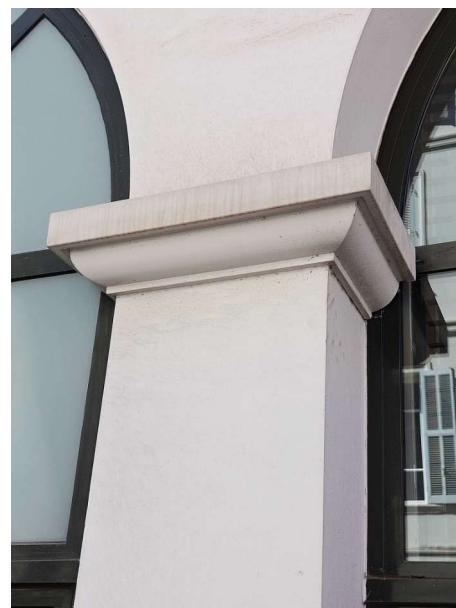
Détail d'un habillage de colonne en façade de l'Hôtel Majestic - Cannes - Acrystal Prima + fibre Acrystal 200-4D - Panneaux stratifiés de +/- 7 mm d'épaisseur